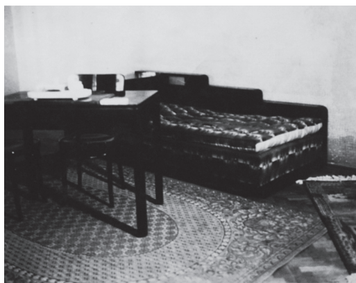
Camera ofițerului de zi