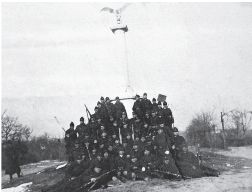
Școala Instructorilor 1931-1932

“Școala instructorilor este bine îndrumată și va da frumoase rezultate.