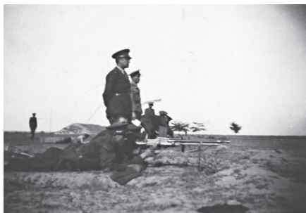
Concurs de tragere

Din împărțirea premiilor, cari se cifrează anual la câteva mii de lei, regimentul caută să facă o adevărată sărbătoare și cu acest prilej câștigătorii au îndoita bucurie: de a primi recompensă materială și mai ales strângerea de mâna a comandantului lor, cum și citirea prin ordin de zi pe regiment.