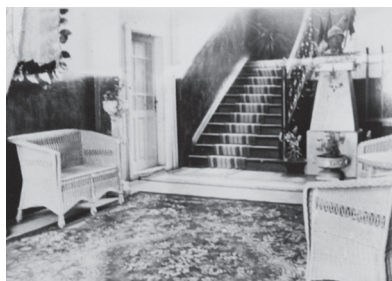
Holl-ul pavilionului de administrație