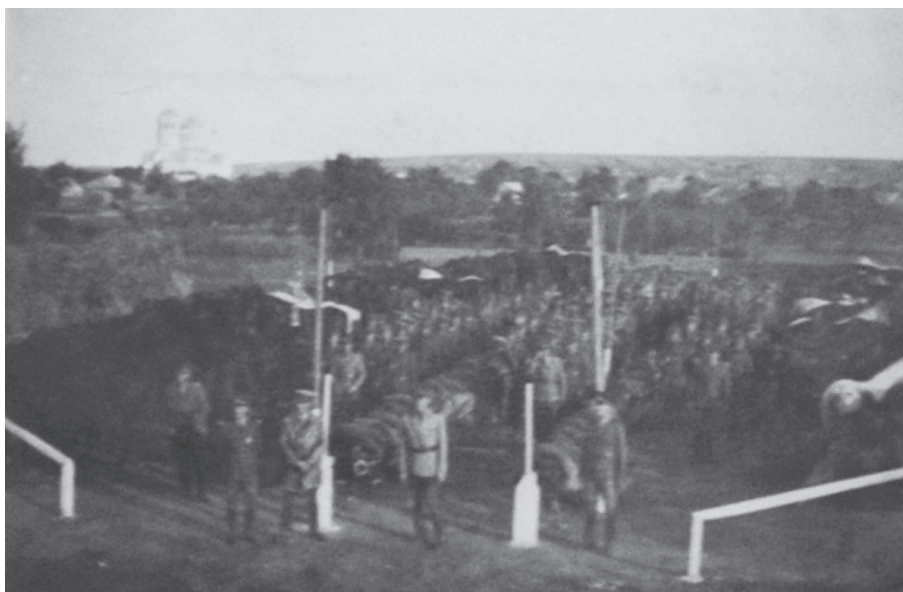
Conovățul escadronului 4 pe zona de concentrare Ceadăr-Lunga (Basarabia)

În acest mod, pe lângă completarea instrucției trupei, se face o temeinică instrucție a cadrelor, în special al ofițerilor, cari în loc să fie puși, pe câmpul de exercițiu, să comande unități marcate li-se dă posibilitatea să conducă unități cu efective reale.