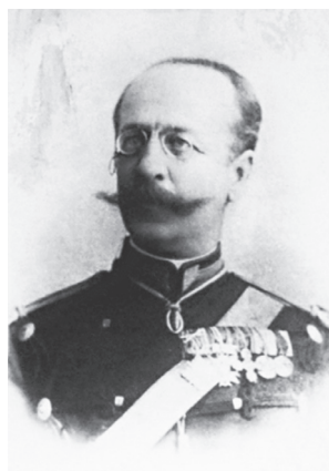
Colonelul Sainoglu Lascăr 1906