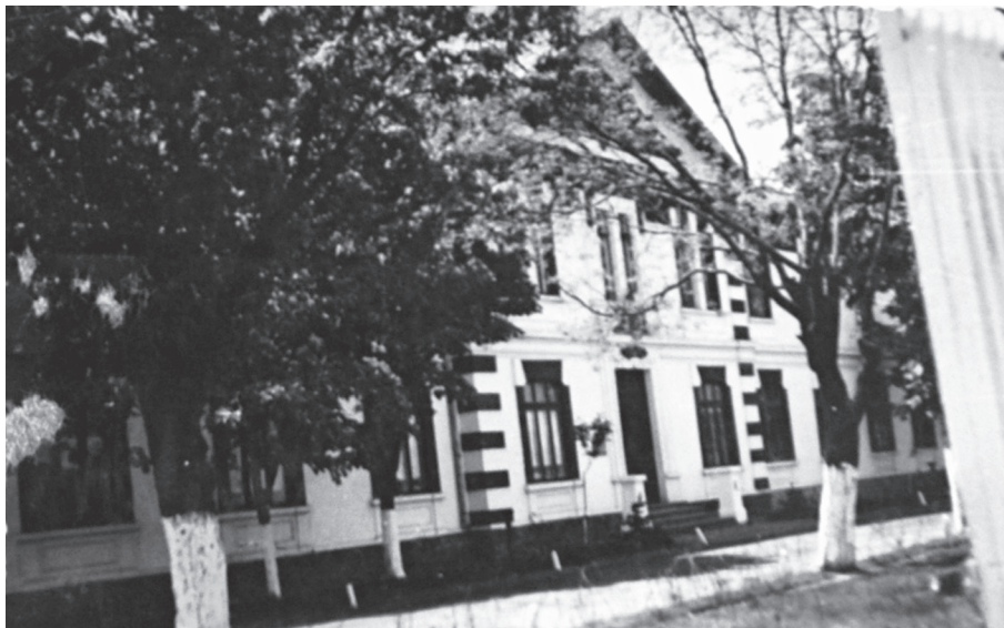
Cazarma Regimentului, pavilionul de administrație

A dispărut tot ceiace nu convenea ochiului; din șoselele croite la întâmplare, au răsărit alei drepte, pavate cu pietriș sau zgură, mărginite cu arbori și flori și botezate cu numele eroilor din regiment, căzuți pe câmpul de onoare.