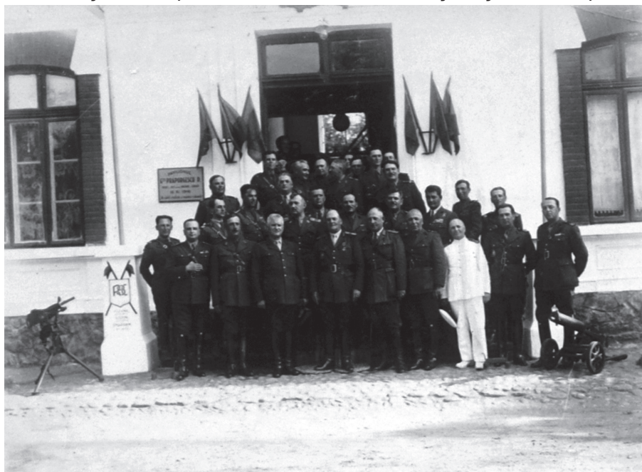
Cu ocazia inspecției Regimentului