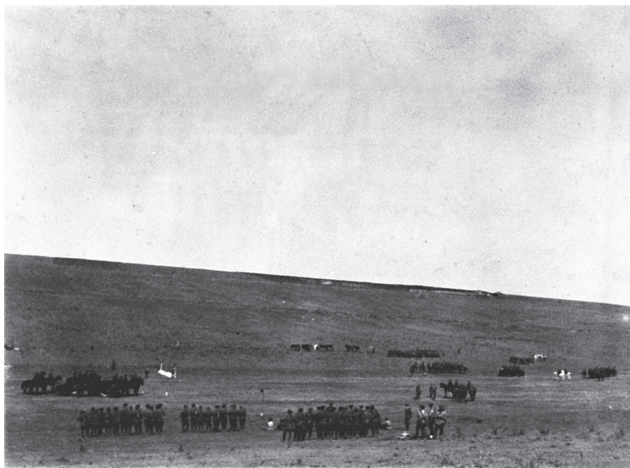
Unitățile pe câmpul de instrucție la Filești, cu ocazia inspecției Corpului de armată.

Aduc deci, mulțumirile mele Comandantului, ajutorului, precum și tuturor ofițerilor pentru munca depusă”.