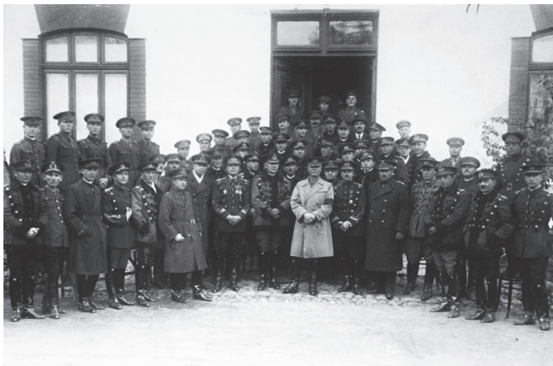
Ofițerii și subofițerii la 8 Noiembrie 1934

Neîncăpătoare, în stare de întreținere ce lasă mult de dorit și impropriu pentru cazarea unui regiment, a fost mai târziu data Batalionului III Administrativ, după ce fusese reparată, curățată, amenajată cu tot ce era necesar ca: lumină electrică, sobe, remize, etc.