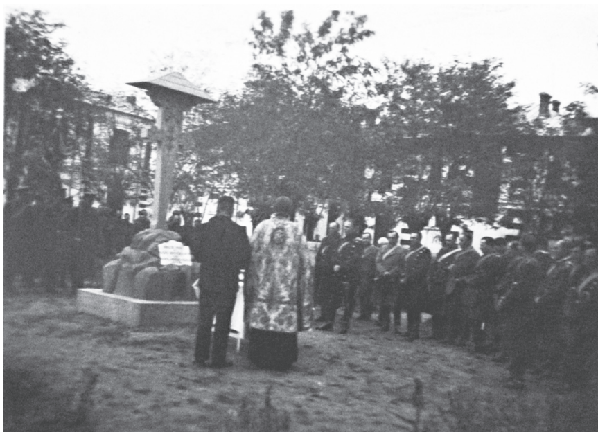
Sfințirea troiței din curtea regimentului

"Adu-ți aminte de Dumnezeu, iată eroii unității tale; urmează exemplul fără șovăire; Acesta să-ți fie idealul".