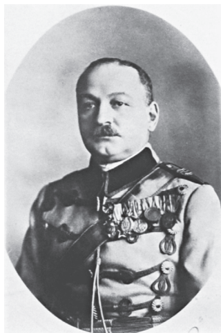
Lt.Col. Rădulescu Theodor 1917

La ora 8, tot dealul Mărăștilor și celelalte rezistențe erau în mâna românilor, iar inamicul fugea îngrozit lăsând în mâinile noastre peste o mie de prizonieri, douăzeci de tunuri, multe mitraliere arme și munițiuni.